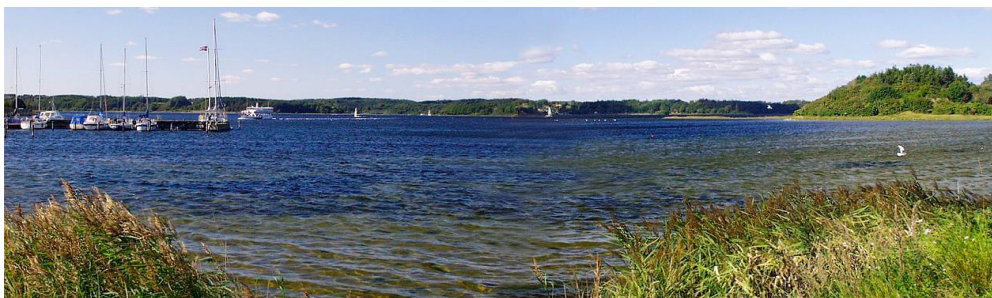
Motiv fra Mariager Fjord (downloadet)

Turen gik videre langs den lange Mariager Fjord, hvortil der var en smuk udsigt. Vejen fortsatte gennem Assens, hvor der ud mod fjorden ligger en stor cementfabrik. I øvrigt er egnen her kendt fra flere af forfatteren Hans Kirks romaner. Lige før Assens kørte vi lidt parløb med to kvinder, der cyklede i en noget speciel indrettet tandemcykel med halvtag, og hvor de sad sideværts. Forunderligt nok cyklede de ligeså hurtigt som os, men de indrømmede da også, at de havde lidt elkraft til rådighed.