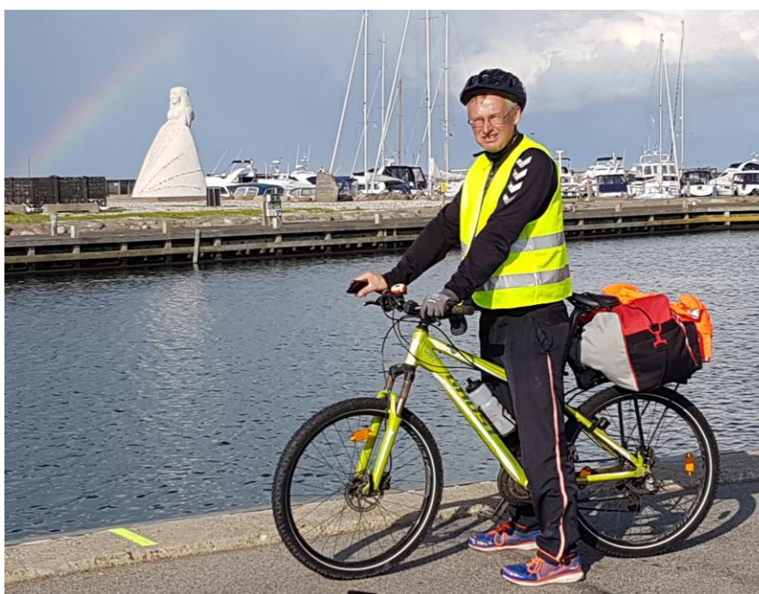
Havnen i Sæby. I baggrunden den store tosidede skulptur "Fruen fra havet" samt en flot regnbue.