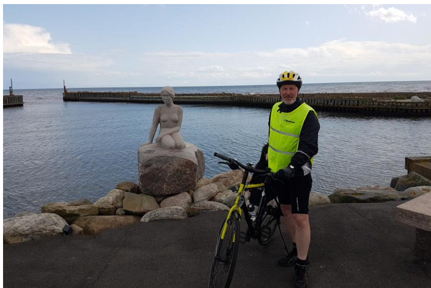
Havnen i Asaa med havfrueskulpturen og mig med min uundværlige cykel.